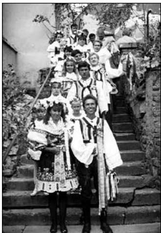
Na starých schodech do areálu v roce 1992

Vavřínecké hody v roce 1992 probíhaly ve dnech 15. a 16. srpna. V sobotu dopoledne byla postavena hodová máje a odpoledne hodový průvod za doprovodu dechové hudby Podboranka prošel Řečkovicemi. V neděli byla sloužena slavnostní mše a odpoledne pokračovala hodová veselice. Tento základní scénář trvá s men-