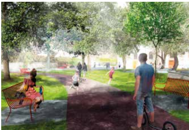
Vizualizace Palackého náměstí