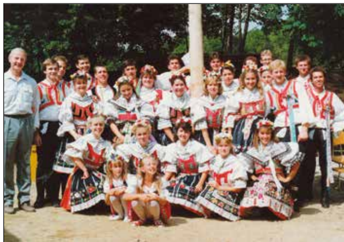
Třináct párů v roce 1992

šími změnami a úpravami do současnosti. K tanci i poslechu hrály dosud na hodech celkem tři dechové kapely – Podboranka, Bojané a hlavně Zdounečanka. Nesporným úspěchem prvních hodů bylo zažehnutí pomyslné hodové pochodně, která hoří již 25 let. Letošní hody tedy budou už dvacáté páté v řadě, a to znamená, že je to nejsouvislejší období novodobých řečkovických hodových dějin.