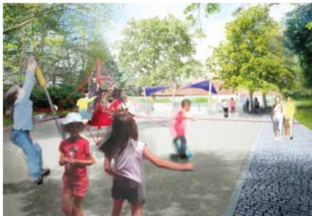
Vizualizace dětského hřiště