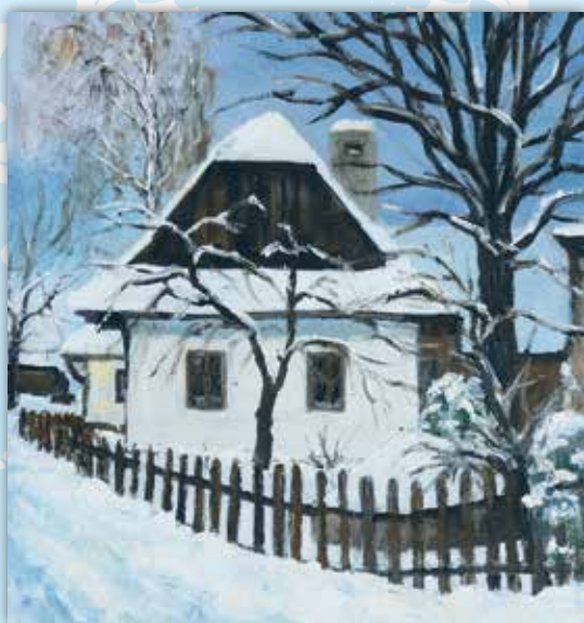
Kresba: H. Puchýřová

Přejeme Vám i všem Vaším blízkým příjemné prožití vánočních svátků a v novém roce 2022 pevné zdraví a mnoho štěstí a spokojenosti.