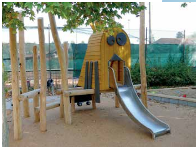
Dětské hřiště Jandáskova