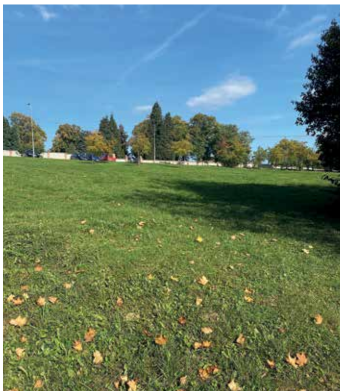
Prostranství pod hřbitovem