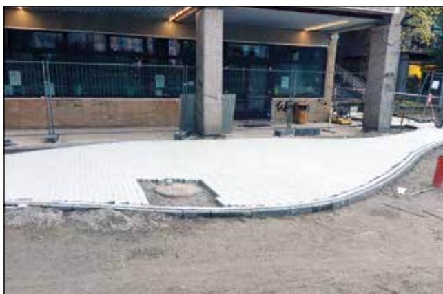
Před novou hospodou se rýsuje nová dlažba

tramvaje. Práce probíhají také na velké části zpevněných ploch ve středisku Vysočina , což považuji za první výrazný krok směrem ke zlepšení jeho celkového stavu. Ve všech uvedených případech se jedná o frekventovaná místa. Chci vám proto na tomto místě poděkovat za potřebnou míru tolerance k jistému nepohodlí způsobenému stavbami. Odměnou nám již brzy budou krásnější a funkčnější veřejné prostory.