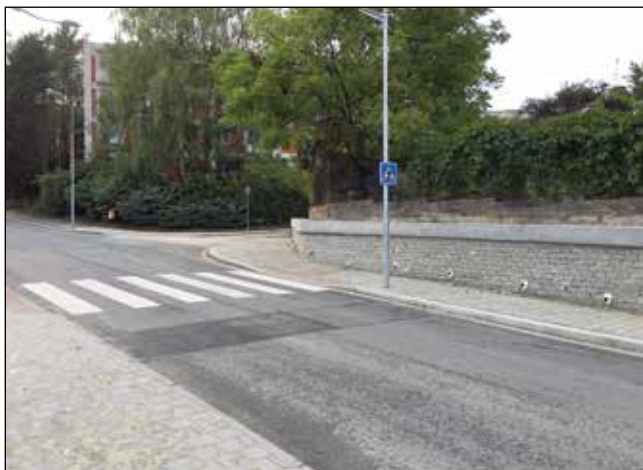
Přechod pro chodce na Družstevní

v parku na Horáckém náměstí (u domů Horácké nám. 6/7 a 8/9), spousta metrů chodníků byla opravena na Novoměstské ulici. Od poloviny září máme nové přechody pro chodce na Družstevní. Rekonstruujeme zpevněné plochy na konečné stanici