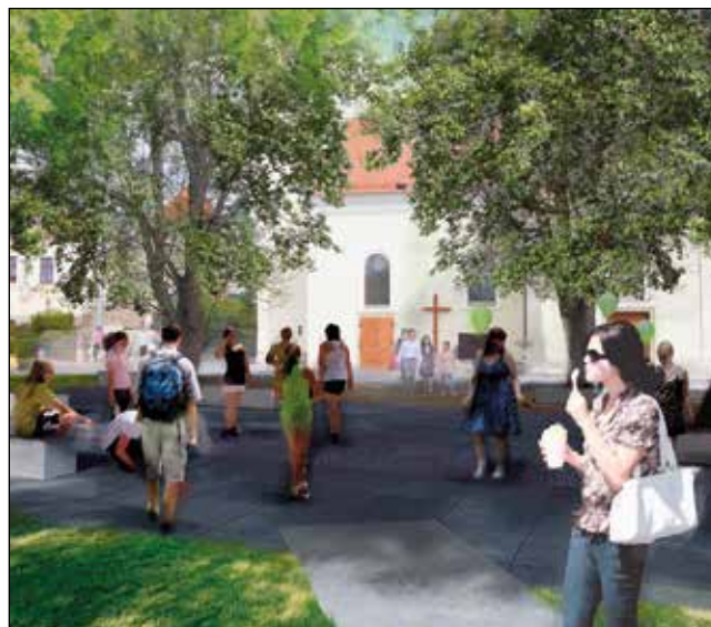
Vizualizace nové podoby parku na Palackého náměstí