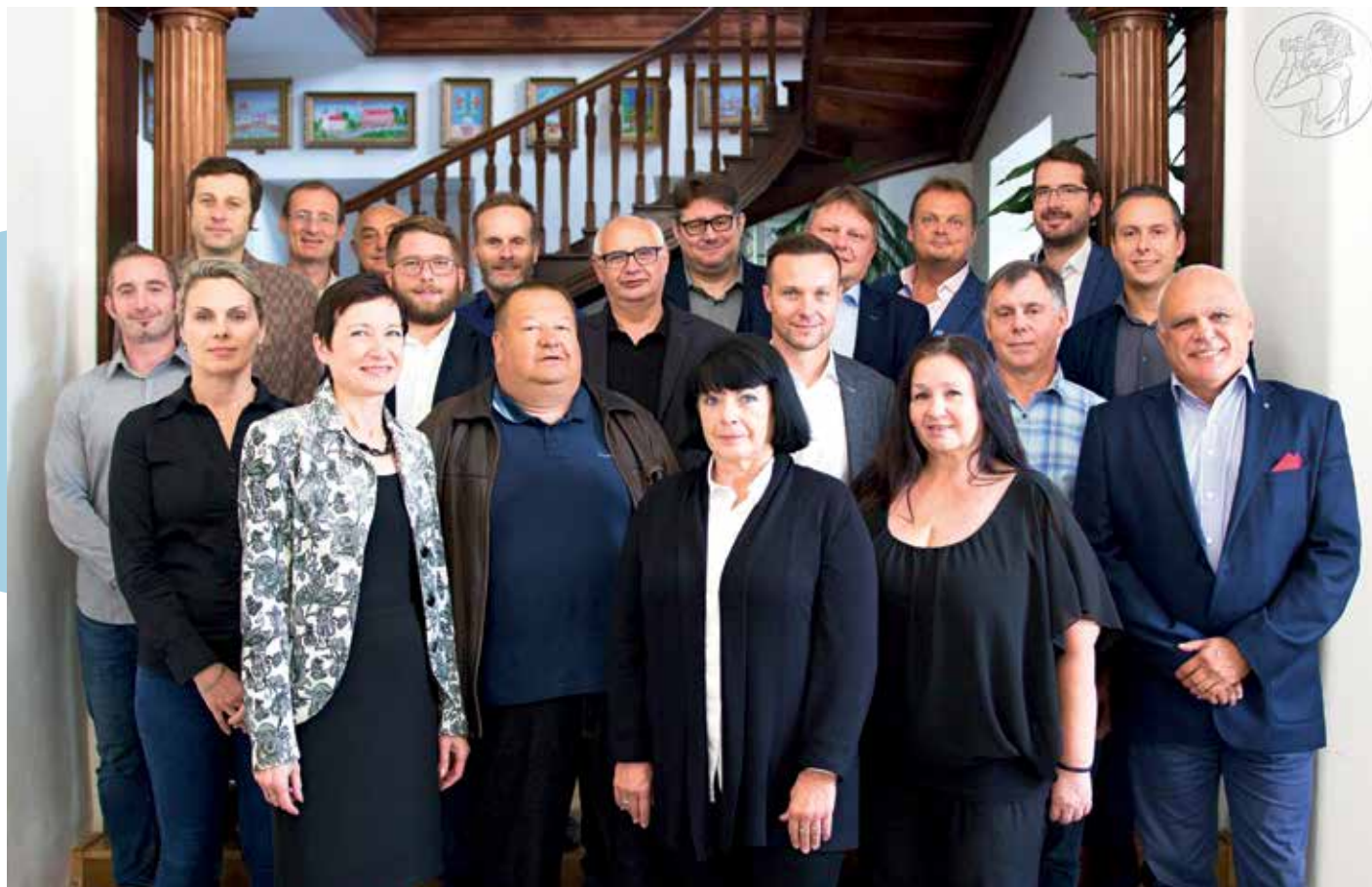
Členové zastupitelstva městské části se 15. září 2022 sešli na svém posledním zasedání končícího volebního období.