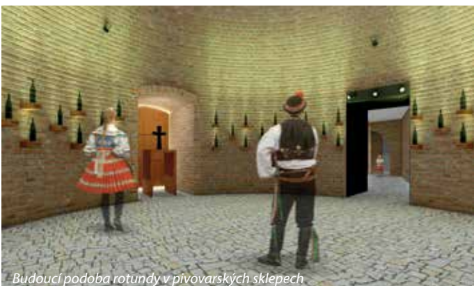
Budoucí podoba rotundy v pivovarských sklepech

Areál za radnicí, kam mnozí chodíme na koncerty, hody, letní noci a jiné kulturní akce, přestal po třech desítkách let splňovat bezpečnostní parametry pro tyto akce nutné, a proto nám nezbývá než ho zrekonstruovat. Celý projekt je pevně svázán i s řešením bývalých pivovarských sklepů, které jsou částečně v havarijním stavu a hrozí zřícením. Postavit nový areál na sklepech ve stávajícím stavu není podle statického posudku možné. A teď to hlavní. Protože jsme si plně vědomi historické ceny části těchto sklepů, rozhodla rada městské části právě tuto část zachránit a zrekonstruovat do důstojné podoby. Jedná se o bývalou pivovarskou varnu, takzvanou podzemní rotundu a k ní vedoucí historickou chodbu z bývalého zámku, dnešní radnice. Jen tato rekonstrukce bude stát 12 milionů korun. A to je právě ta část, kterou můžeme nazývat pivovarskými sklepy. Chodby k nim postavené v pozdějších letech a staletích, které jsou dnes v dezolátním stavu, ale které již nemají a nikdy neměly tu stejnou historickou hodnotu, bude nutné sanovat, aby mohla být provedena oprava areálu. Jinak bychom tu nemohli pořádat už žádné akce, na které jsme všichni v Řečkovících a Mokré Hoře zvyklí. Žádné hody, dětské dny, koncerty.