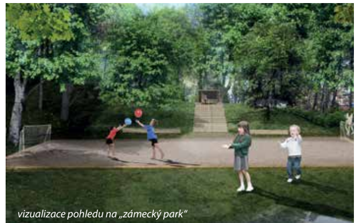
vizualizace pohledu na „zámecký park“