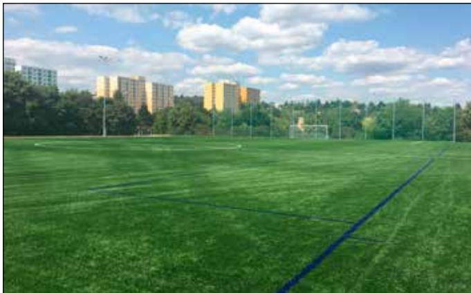
Nové fotbalové hřiště poblíž ZŠ Horácké nám