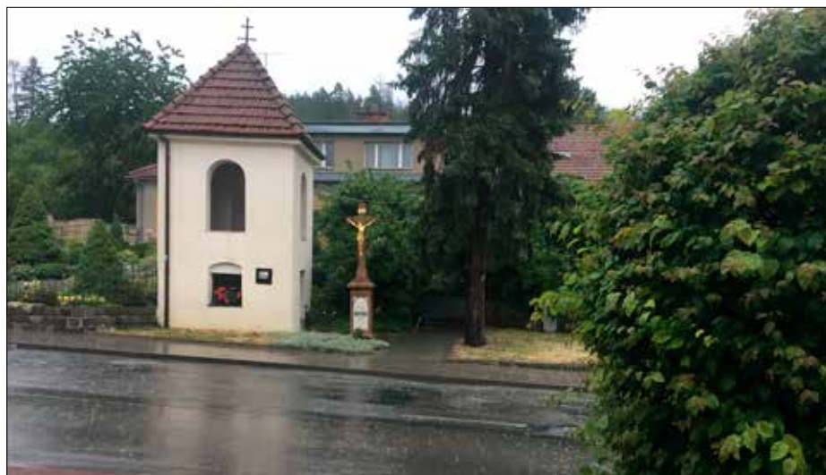
Letní bouře 2019