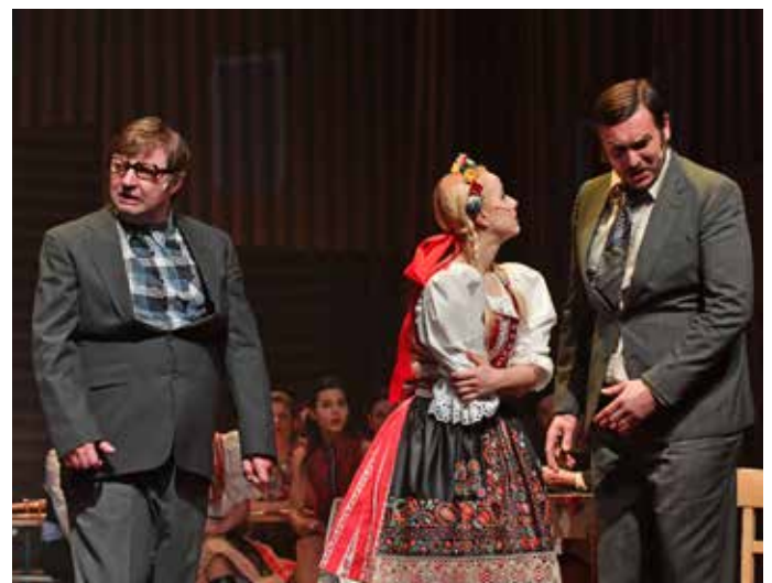
Představení Bítls

No tak stoupněte si na jeviště s legendou. To už samo o sobě v sobě nese určitý závazek, trochu nějakého strachu, pokory nebo něco podobného. Nicméně Boleček mě má myslím moc rád, a já jeho taky. Sblížili jsme se i v soukromém životě. Navštěvujeme se nebo spolu chodíme na pivo. To mi hodně usnadnilo s ním hrát a improvizovat. Takže teď už si na něho i trochu dovolím, pokud on mi to dovolí. A je pravda, že já od něj dostávám poměrně dost prostoru. Ale někdy, když má Bolek náladu, tak vás dokáže zahnat do kouta, kde vás drží, směje se vám a hraje si s vámi jak kočka s myší. To jsou chvíle kdy, ne že by mne to nebavilo, ale je dost těžké to odrazet. Bolek je neskutečně pohotov, strašně chytrý, vzdělaný a sečtělý člověk. To znamená, že on má kde brát, a dokáže těch point „vysolit“ dvanáct během čtyřiceti vteřin, čehož já samozřejmě schopen nejsem. A on se baví tím, že toho nejsem schopen, takže mne tam drží, pak si to vypointuje sám, a jde od toho. Já jsem pak úplně mokřej, stojím tam jak blbeček a doufám, že už bude konec, že už nic dalšího nepřijde. A samozřejmě, že řeknu jednu větu, a jsem v tom koutě zpátky (smích).