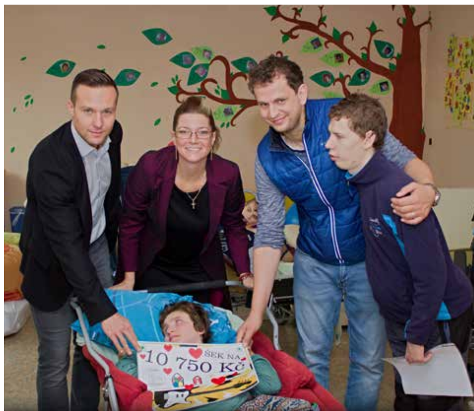
Předání výtěžku z loňské akce

Nejen zakoupením lístku pomůžete dobré věci, ale také si můžete zakoupit speciální edici charitativních kalendářů na rok 2020 na místě konání akce. Vstupenky a kalendáře je možné zakoupit elektronicky přes e-mail. V případě zájmu mne prosím kontaktujte na info@luciekovarova-fotografka.cz .