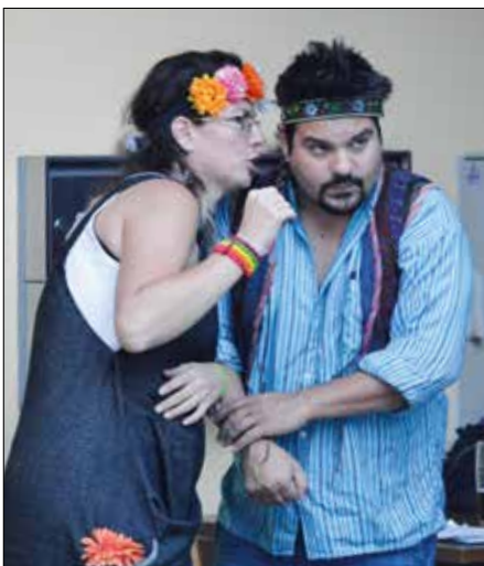
Momentka z loňské akce

No těch bylo opravdu mnoho. Teď si ale vybavuji jednu historku. Když jsme hráli pro vojenskou školu v Moravské Třebové, přišla k veliteli paní, co se starala o knihy, a říkala mu, že jim ještě chybí