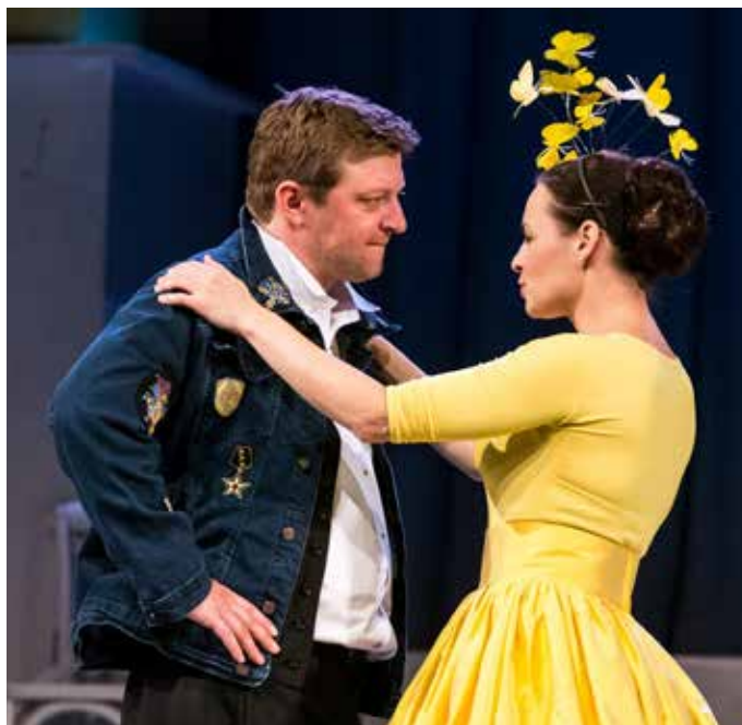
Představení Nebezpečné vztahy

Slibili jsme si, že se sejdeme, ale ještě se nám to nepovedlo. Říkal mi jenom, že si musím dávat pozor na alkohol, který mi tam budou nabízet. To se mi doufám podaří, protože oba ty dva dny budu řídit. V neděli musím ještě v noci odjet do Prahy, takže pít ani nemůžu. Proto si myslím, že tuhle radu nějakým způsobem dodržím. Ještě říkal, že je to velmi příjemná akce, prý se nemá čeho bát a že jsou tam všichni hodní (smích).