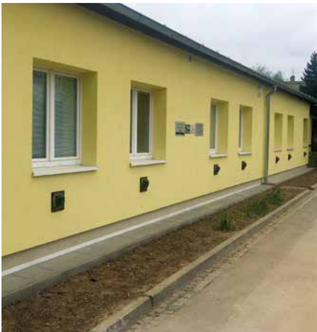
Nová fasáda budovy ZUŠ v Kořenského ulici