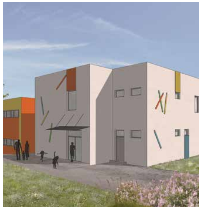
Vizualizace nové budovy v areálu MŠ Měříčkova