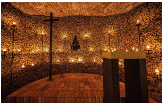
Otvírá se i brněnské podzemí.

Po dlouhých týdnech nuceného klidu ožívají ulice Brna a postupně se otvírají instituce nejen ve městě, ale také v celém kraji. Přinášíme souhrnné informace, kam se můžete vydat a na co se těšit. Vše samozřejmě při dodržování předepsaných bezpečnostních pravidel.