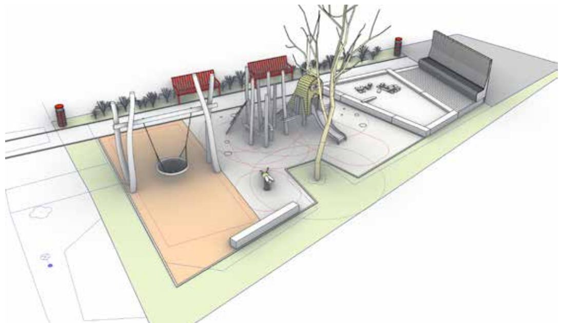
Dětské hřiště Jandáskova