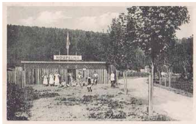
Dobová pohlednice z roku 1920

Snad se nám konečně oteplí a začnou letní radovánky. Zahradky s oroseným mokem, výlety, třešně, a v neposlední řadě koupání venku. To v dnešní době spousta z nás řeší na vlastních zahradách, malými nafukovacími bazény počínaje a zapuštěnými bazény konče. Ovšem naši předci toto běžně neznali, museli spoléhat na přírodní a popřípadě veřejné koupání. Takže když byla roku 1911 otevřena v Mokré Hoře veřejná plovárna, jistě tuto novou možnost osvěžení přivítali.