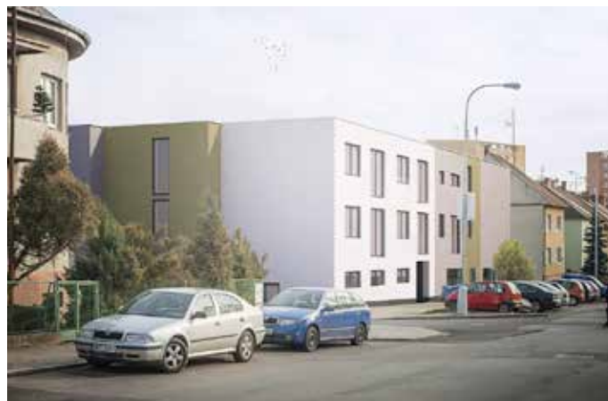
Budoucí podoba domu Měříčkova 18

To znamená, že nákladný úklid, spočívající v odtěžení zeminy, srovnání terénu a vyčištění od kamení, betonových skruží a jiného materiálu, bude hrazen z rozpočtu města. To vše při snaze o maximální zachování zeleně. Pokud se městu podaří získat stavební povolení dle předpokladů, můžeme zahájení prací očekávat už v druhé polovině příštího roku. Součástí úvodní etapy je také průchod (nikoliv průjezd) přes inkriminovaný pozemek z Terezy Novákové do sídliště Kremličkova, Škrétova, Renčova a dále. V návaznosti na tuto akci navíc požádáme město také o řešení přechodu pro chodce v blízkosti nových bytových domů, aby se pěší komfortně dostali na ulice Bohatcova a Veselka.