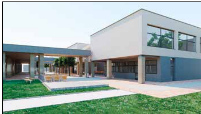
Vizualizace budoucího stavu

Co vám v rámci rekonstrukce areálu udělalo největší radost, a co vám naopak ke spokojenosti ještě schází?