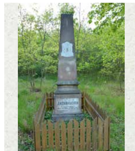
Pomník hajného Kučírka