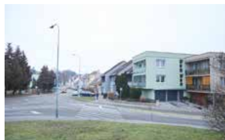
Místo, kde stála pastouška