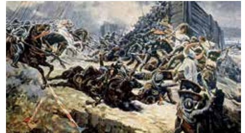
Takto si představoval bitvu husitů malíř Adolf Liebscher