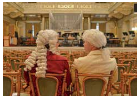
Bach s Mozartem v Besedním domě

10. 2. 2022 | 19:00 | Besední dům Czech Ensemble Baroque | www.bachanamozarta.cz