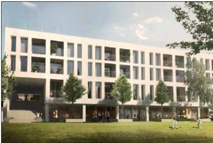
Studie nového bytového domu

Právě o vývoji v obchodním centru Vysočina vás informuji pravidelně, protože stejně jako vy cítím, že se jedná o důležitou stavbu v samém cen- tru obce. Dovolím si malou rekapitulaci současných vlastnických poměrů a plánů jednotlivých vlastníků. Naše městská část, město Brno, ani stát nevlastní v areálu žádné budovy. Přímý vliv na to, co se zde bude dít, jaké tady budou obchody a služby, tedy nemáme. Přesto chceme, aby celý areál co nejlépe sloužil občanům a také aby nějak vypadal. Hlavní slovo v tom budou mít současní majitelé a my jsme připraveni s nimi jednat a jejich užitečným, rozumným a moderním nápadům na rekon- strukci vyjít vstříc, protože současná podoba celého objektu je neuspo- kojivá, jeho technický stav je zanedbaný a oku nelahodící. Věřím však, že se blýská na lepší časy.