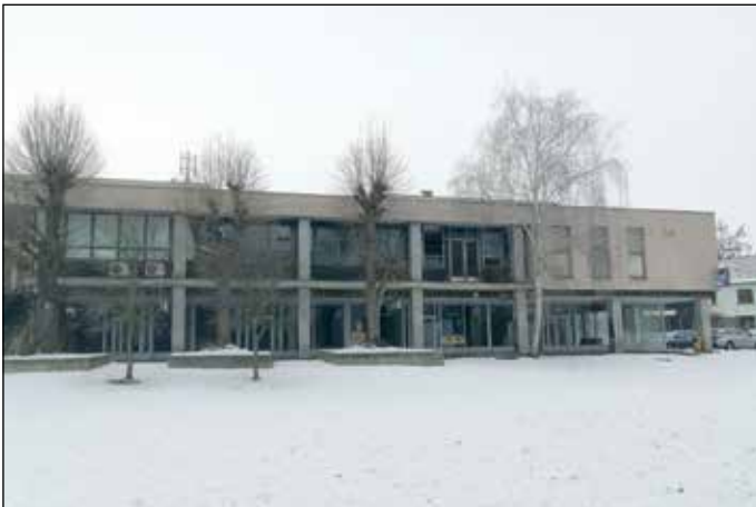
Vysočina - stávající situace

Jistě jste zaznamenali, že se v části Vysočiny, kde dříve bylo třeba ka- deřnictví nebo papírnictví a nahoře herna, bowling a ještě dříve restaura- ce, něco chystá. Obchody a služby dostaly od vlastníka výpověď, protože ten naplánoval rekonstrukci objektu a výstavbu bytů. Městská část po- dala proti tomuto stavebnímu záměru námítky, které směřují k ochra- ně zájmů obce a jejích občanů. V čem spočívají a co se nám vlastně nelí- bí? Pojdme se na to podívat pěkně v souvislostech a popořádku.