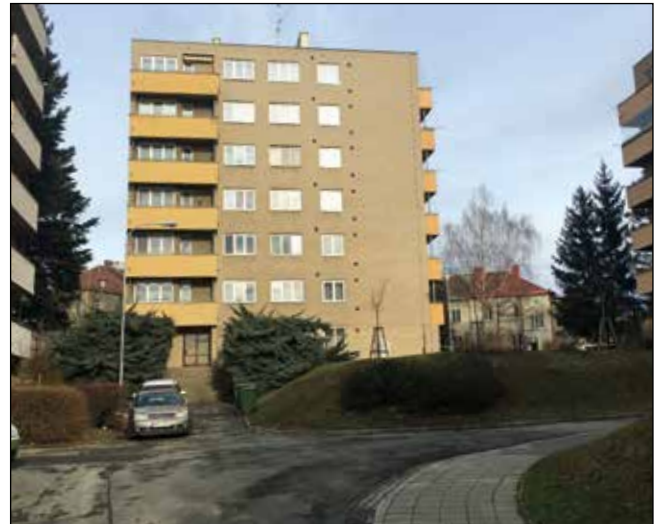
Okolí bytových domů Ječná