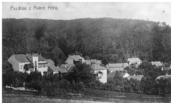
Dobová pohlednice Mokrých Hor, kolem roku 1920

Letos uplyne 100 let od vzniku tzv. Velkého Brna. Mezi tehdy připojené obce patřily i Řečkovice.