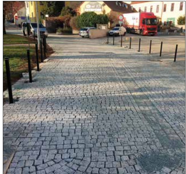
Na úpravu před kostelem naváže revitalizace parku

Fakticky naší městské části významně přispěli také ti, kteří v rámci participativního rozpočtu města hlasovali pro návrh nové nafukovací haly na hřišti v areálu ZŠ Novoměstská. Celkem pro ni hlasovalo skoro tisíc osm set občanů, což je nejlepší výsledek v naší čtvrti za tříletou historii participativního rozpočtu. V Řeč-