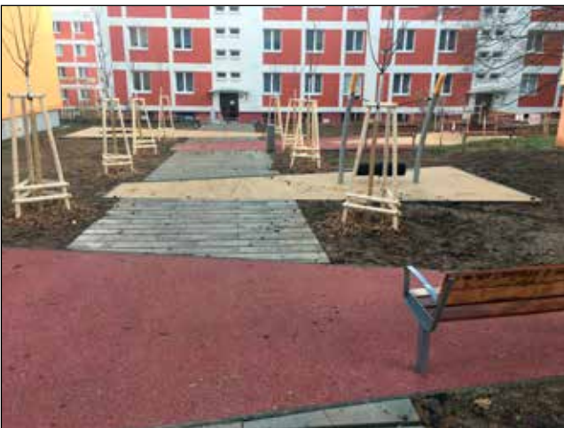
Nové dětské hřiště v Družstevní ulici těsně před dokončením

První oblastí, kterou zmíním, jsou veřejná prostranství . V princi uplynulého roku jsme dokončili druhou etapu revitalizace ploch mezi domy v Družstevní ulici . Tato akce je příkladem, jak bychom v budoucnu mohli některé celky řešit. Projekt se totiž zabýval jak stavem veřejné zeleně, tak stavem chodníků a zpevněných ploch. Přibylo i dětské hřiště a nová místa k posezení. Podobný přístup volíme také v případech okolí bytových domů v Ječné ulici , kde jsme loni získali stavební povolení a letos jsou na řadě stavební práce. Další lokalitou, kde bychom měli rádi připravenou projektovou dokumentaci, je okolí domů v ulicích Kárníkova a Bratří Kříčků.