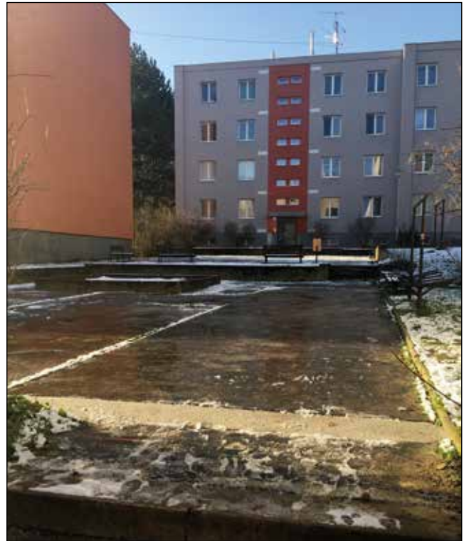
Okolí domů na Družstevní projde výraznou proměnou

V rámci provozních výdajů pokračujeme ve zvyšování prostředků na opravy chodníků (konkrétně půjde o opravy v ulicích Novoměstská, Renčova, Kárníková, Žitná, Horácké nám.). Posílení této položky bylo nepochybně potřeba, proto letos zvyšujeme celkovou částku o třiatřicet procent na čtyři miliony korun. O deset procent, na částku půl milionu korun, zvyšujeme též příspěvky spolkům . Jedná se o organizace, jejichž práce využíváme prakticky všichni, ať už přímo my, nebo naše děti (Junák, Sokol, Pionýr, Knihovna Jiřího Mahena, Orel, TAK Hellas, SK Řečkovice a mnoho dalších).