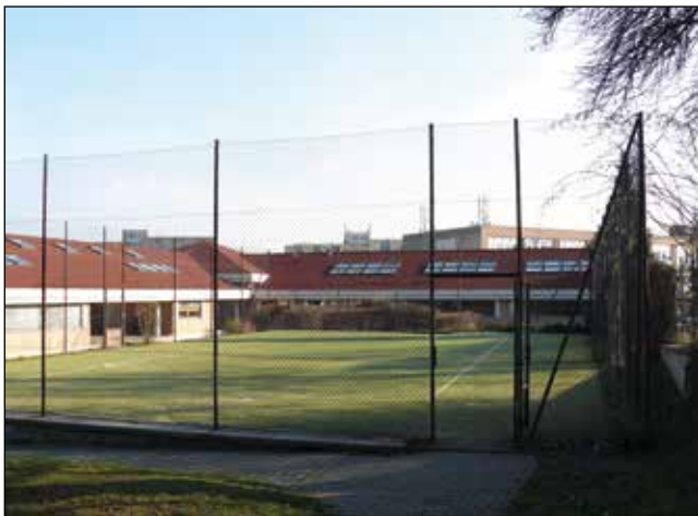
V létě se nového hřiště dočkají žáci na Uprkově

Co se školství týče, na rekonstruované plochy se může těšit škola v Uprkové ulici . Víceúčelové hřiště se dočká nového povrchu a vedlejší dětské hřiště bude osazeno novými herními prvky. Součástí projektu je také venkovní učebna, kterou žáci a učitelé jistě rádi využijí především za hezkého počasí. Mezi další významné akce řadíme rekonstrukci elektroinstalací ve školce v Kárníkové ulici a zastřešení vstupu a opravu zpevněných ploch u školy v ulici Novoměstské.