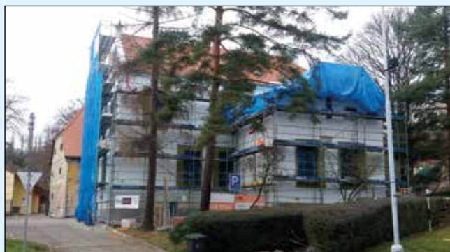
Bytový dům Palackého nám. 9

Mnozí z Vás se ptají na právě rekonstruovanou budovu na Palackého náměstí 9, stojící hned vedle radnice. Dovolte proto, abych uveřejnil pár slov k této stavbě. Tento dům byl v minulosti součástí pivovaru, v současnosti je v majetku města Brna. Již před desítkami let zde byly zřízeny obecní byty, ale celá stavba se postupem času dostala do velmi špatného stavu, a to jak z hlediska stavebnětechnického, tak hygienického. Jako řádný hospodář přistoupilo vedení městské části a bytový odbor k celkové rekonstrukci této budovy. Nově tak vzniknou 4 moderní bytové jednotky, prostory pro uskladnění materiálů radnice a v neposlední řadě přispěje oprava k celkově lepšímu pohledu na celou historickou část Palackého náměstí. Tento dům je navíc významný i tím, že se v něm nachází hlavní přístup do tzv. řečkovického podzemí. Jedná se o poměrně rozsáhlý komplex bývalých pivovarských sklepů, který si jistě zaslouží naši pozornost. Celkově ještě není Palackého náměstí v té kondici, jakou bychom si všichni představovali, ale jeho nová podoba je již vyprojektována a rekonstrukce zmíněného domu je jedním z kamenů pomyslné mozaiky.