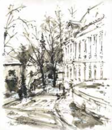
Autor Stanislav Sedláček

Nechť blízké dny vánoční stanou se skutečnými svátky, jež panují ostatním, než přemění se v minulost. A nový rok 2025 ať příznivě zapsán zůstane ve Vašich vzpomínkách, přeje