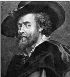
Petr Pavel Rubens