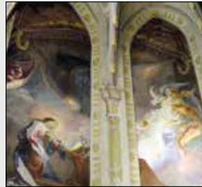
Zvěstování, kostel Nejsvětější trojice