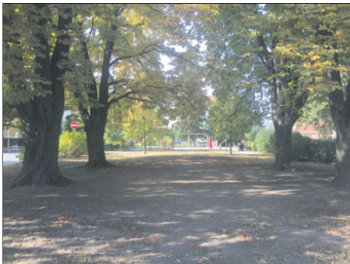
Náměstí Vojtěšky Matyášové