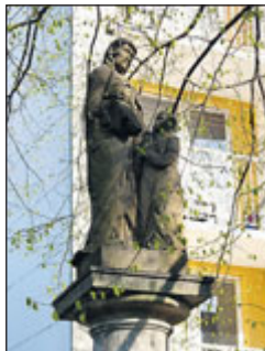
Socha sv. Anny na Novoměstské ulici

Novoměstská – ulice, která se nachází v Řečkovicích, byla pojmenována roku 1971 podle Nového Města na Moravě, ležícího severozápadně od Brna. Zajímavostí této ulice je socha sv. Anny, která zde stávala již v 18. století, původně byla dřevěná, od roku 1908 zde stojí socha kamenná. Dříve zde byla velmi frekventovaná křižovatka cest.