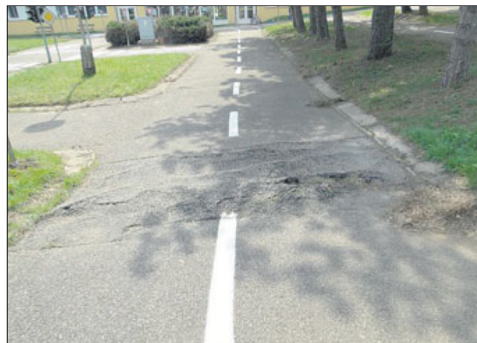
Dopravní hřiště, kterým za desítky let užívání prošly tisíce dětí je v havarijním stavu a jeho oprava je v seznamu úkolů, které se radnice rozhodla prioritně řešit. Nutnost dopravní výchovy mladých chodců a cyklistů je jedním z prioritních témat dnešní doby což podporuje i starosta městské části.