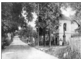
Ulice Tumaňanova (1917)

Tumaňanova – ulice patří především do katastru Mokrý Hory, ale několik posledních domů spadá pod Jehnice. Tato ulice, jediná hlavní tepna Mokrý Hory, nese jméno po důstojníkovi Rudé armády, který zde padl v osvobozovacích bojích v dubnu 1945. Pojmenována byla až roku